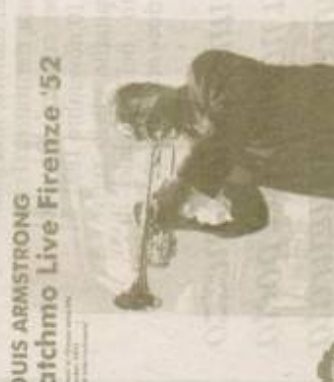
LOUIS ARMSTRONG Satchmo Live Firenze '52