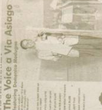
The Voice a Via Asiago Featuring Domenico Modugno con Frank Sinatra con l'Orchestra Eclipse guidata da Armando Trovajoli. Fu un momento storico cui prese parte anche un giovanissimo ed esordiente Domenico Modugno che rese omaggio al maestro con «Ninna Nanna»