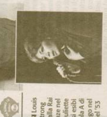
GLI ASSI Louis Armstrong suonò alla Rai di Firenze nel 1952. Juliette Gréco si esibì nella sala A di via Asiago nel '52 e nel '53