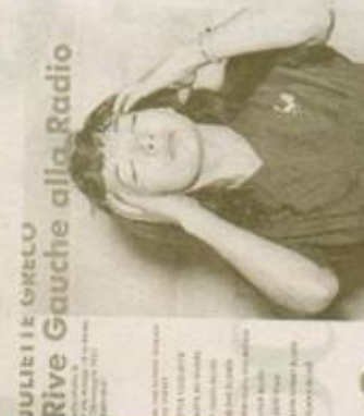
JULIETTE GRÉCO Rive Gauche alla Rai